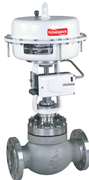
Reglerventil med pneumatiskt membranställdon